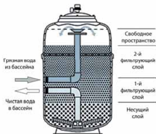
Рис.3 Фильтр в режиме фильтрации

Для механической очистки воды (снижения мутности) обычно применяют картриджные, намывные или песчаные фильтры (высоко-эффективные и наиболее распространенные), поэтому далее речь будет идти именно о песчаных фильтрах.