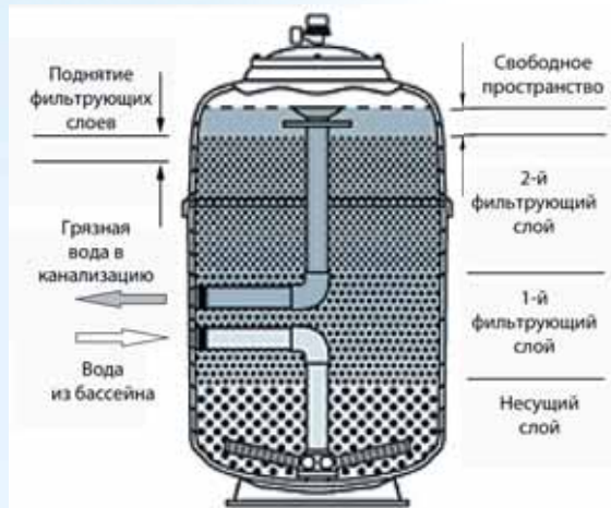
Рис. 4 Фильтр в режиме «обратной промывки»

В ходе «обратной промывки» (для этого необходимо переключить многоходовой вентиль в соответствующее положение) вода из бассейна поступает в фильтровальный бак через нижнее распределительное устройство таким образом фильтрующий материал как бы «взрыхляется». При этом частицы загрязнений (т.к. они легче песка) поднимаются вместе с водой вверх, проходят через верхнее распределительное устройство и сбрасываются вместе с загрязненной водой в канализацию.